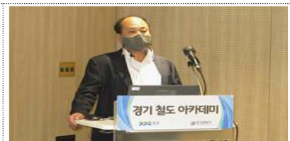
경기 철도 아카데미